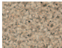
PFL – песочный